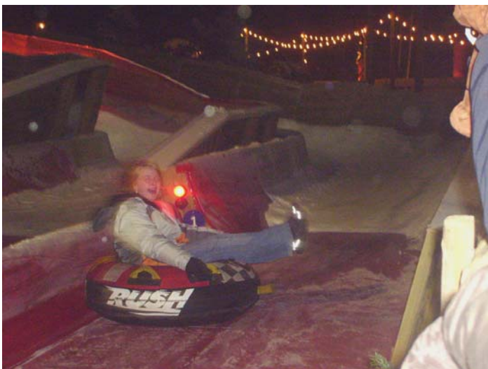
Hüttenrestaurant konnten wir ins auch wieder aufwärmen. Alle waren einer Meinung, dass dies eine gelungene Veranstaltung war.

Weihnachten war in aller Munde, warum auch nicht bei uns im Hamelner Tauchclub. Winter Zoo hieß das Zauberwort, nur was ist Winter Zoo?